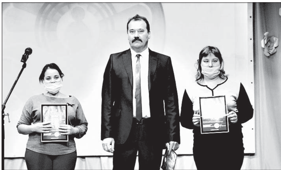
Председатель Чагинской организации ВОИ награждает активистов