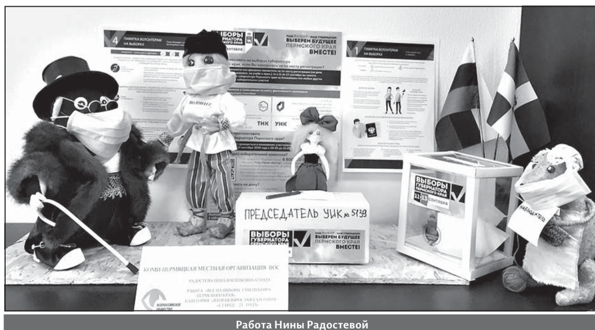
Работа Нины Радостевой