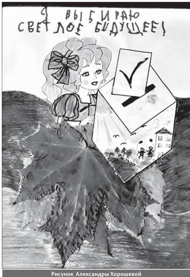
Рисунок Александры Хорошевой

Все победители и призеры получат вознаграждения за свои работы.