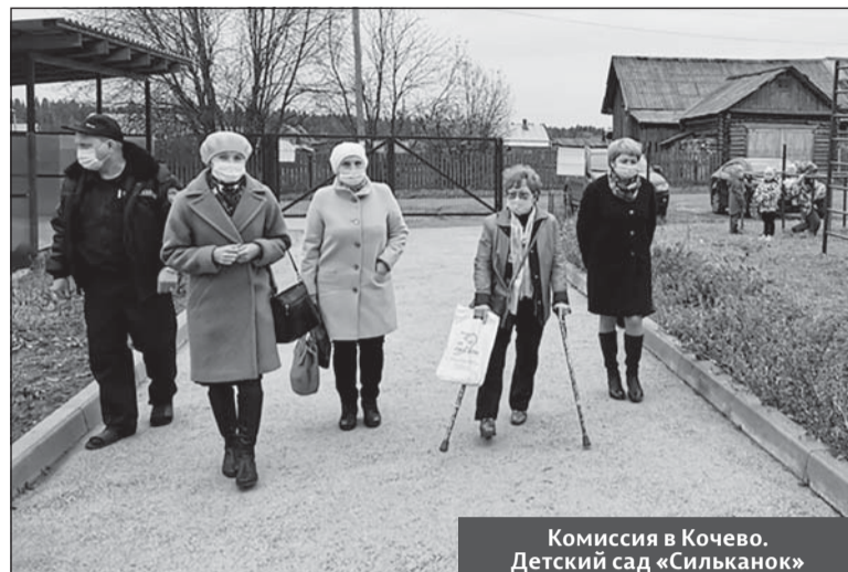
Комиссия в Кочево. Детский сад «Сильканок»

В течение октября – ноября нынешнего года работала комиссия конкурса «Доступная среда» среди муниципальных образований Пермского края. Оператором конкурса, организованного министерством социального развития Пермского края, выступили Пермская краевая организация ВОИ, исполнителем – АНО «РИЦ «Доступная среда».