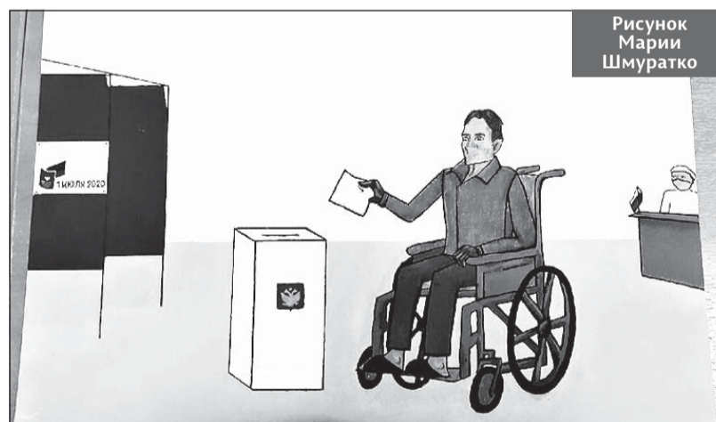
Рисунок Марии Шмуратко