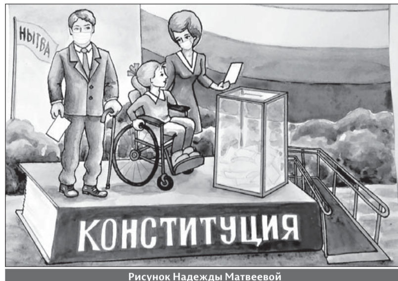
Рисунок Надежды Матвеевой