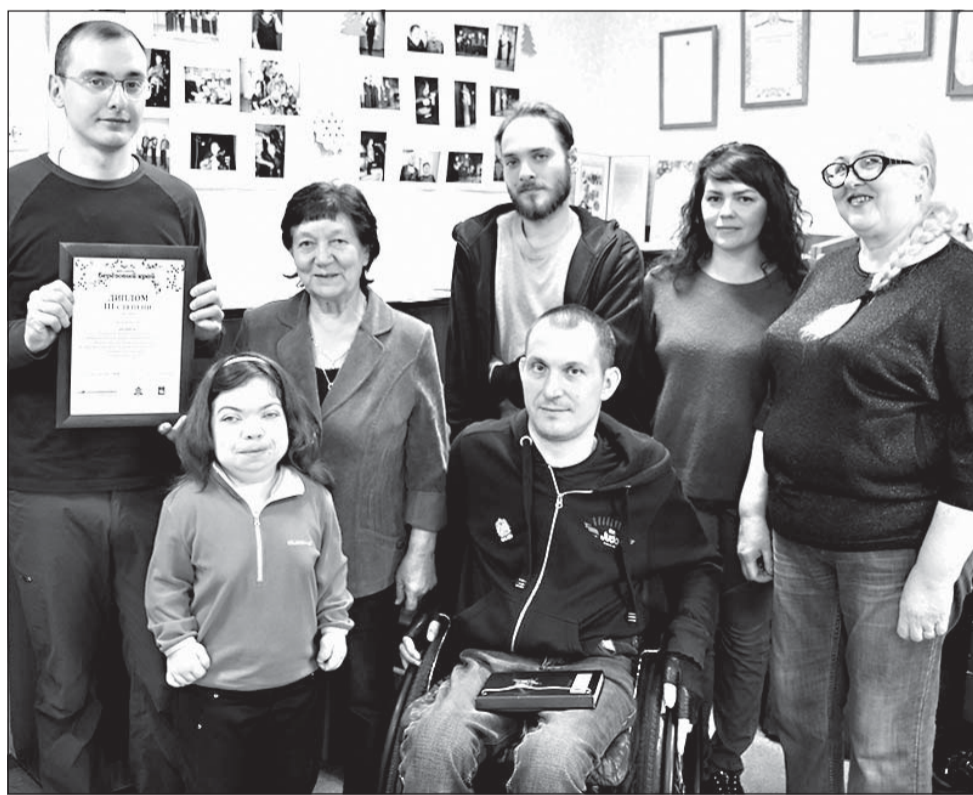
Третье место – у вокального коллектива музыкальной студии ПКО ВОИ