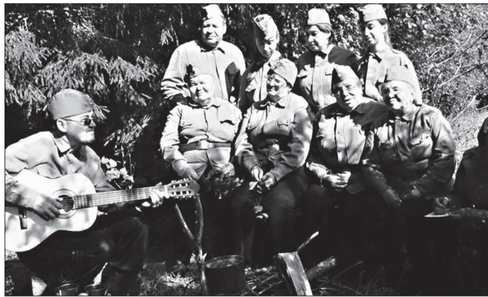
Коллектив хора «Молодушка» из Александровской организации занял второе место

ганизации ВОИ стали поступать видеоролики с пометкой «Березовый край». В день пришло по несколько видеороликов, а от Александровской окружной организации было выставлено два коллектива – это ансамбль «Поющие сердца» и хор «Молодушка», поселок Луньевка. Репертуар песен, присланных на конкурс, разный. В программе обработки народных песен, произведения российских композиторов, а также песни местных авторов. Сразу видно, что песенные коллективы знают и любят песни о войне. Только вслушайтесь в их названия: «Ехали солдатушки», «Вдовы России», «На поле танки грохотали», «Елизавета». Всего на конкурс песни прислали заявки 19 организаций из разных территорий Пермского края, дистанционно приняли участие более двухсот человек. Молодцы! Смогли перестроиться на новый формат, преодолеть трудности организации, записи, справились с компьютерной версткой и, конечно же, приобрели немалый опыт.