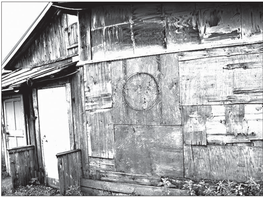
Вход в уже бывшую Любину квартиру

Власти Нытвенского городского округа посчитали инвалида второй группы слишком богатой – и выселили из ветхого жилья