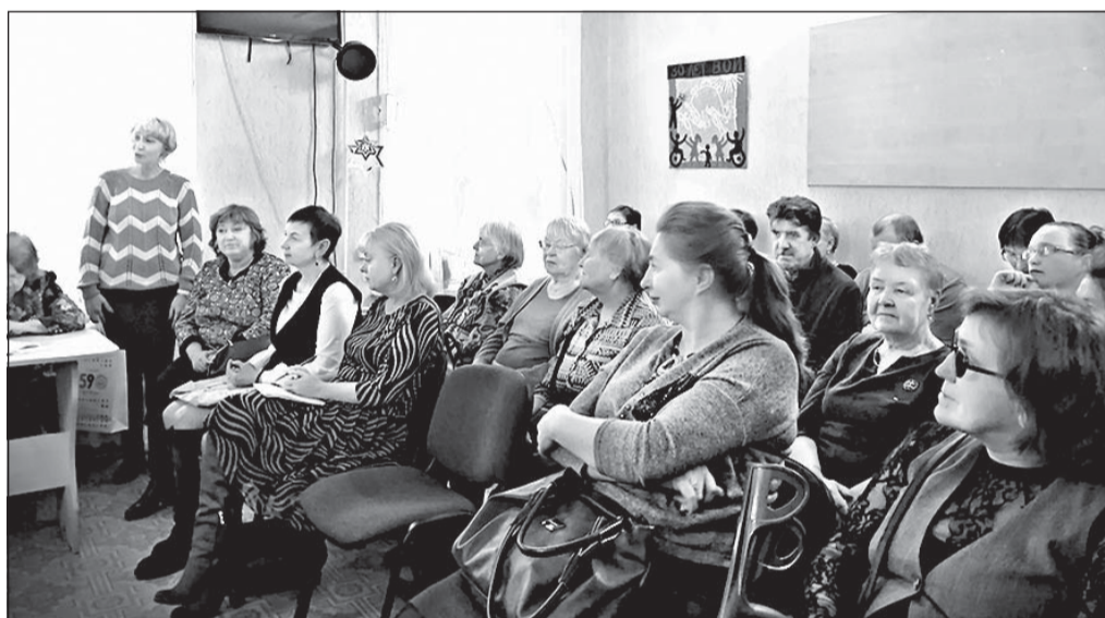
Делегаты и гости отчетно-выборной конференции Соликамской ГО ВОИ