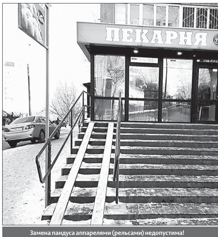
Замена пандуса аппаратами (рельсами) недопустима!