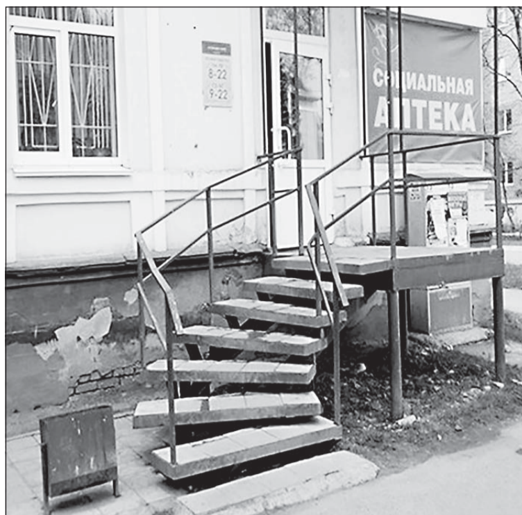
Аптека недоступна, так как у ступенек открытый подступенок, поручни не заходят за линию лестничного марша на 0,3 м, лестница не продублирована пандусом

Кроме порогов на входе, незнания, как помочь инвалиду сделать покупки, есть и другие моменты, которые составляют трудности в крупных ма-