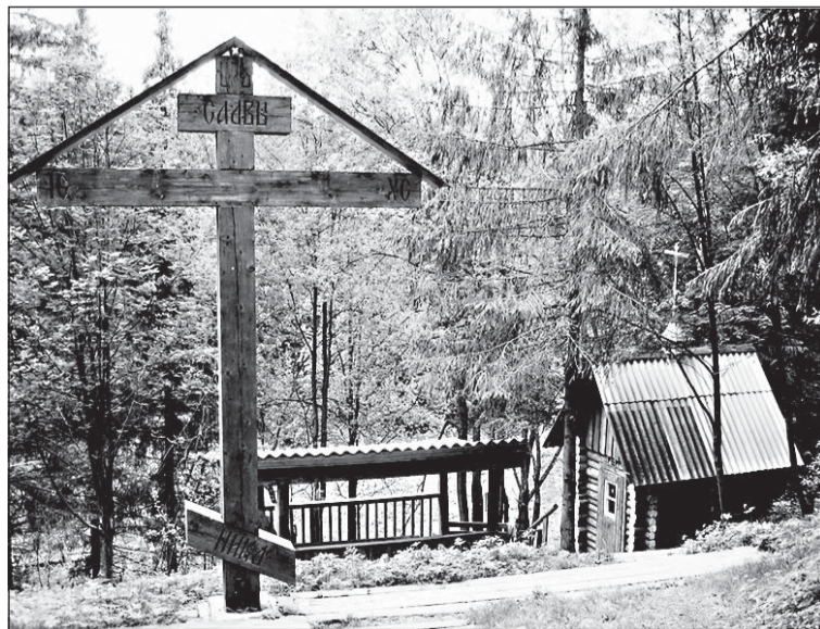
Родник, святой источник преподобного Серафима Саровского у села Тараканово