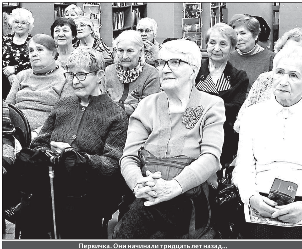
Первичка. Они начинали тридцать лет назад...