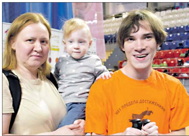
С мамой и младшей сестрой