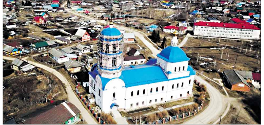
Село Орда. На переднем плане храм Ильи Пророка

СЕЛО ОРДА ведет свою историю с 1601 года. В письменных источниках начинает упоминаться с 1662 года под названием «Село Ильинское Орда ток», или «Ильинский острожек». Расположено село на реках Кунгур (приток реки Ирень) и Ординка. В России известно тем, что в его окрестностях находится самая длинная в стране подводная пещера. Район сельскохозяйственный, но славится также своими камнерезами (первая мастерская по обработке селенита была открыта в 1894 году) и гончарными мастерами. Славилось село Орда и тем, что в отличие от остальных сел Прикамья, в нем было много каменных построек из кирпича, который производился здесь же из местной глины. Часть из них сохранилась до сих пор.