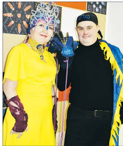
Дуэт «Жар-птица и дракон», г. Добрянка