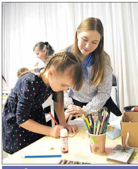
Занятие по оригами проводит студентка педуниверситета