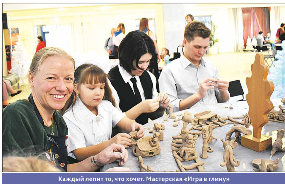
Каждый лепит то, что хочет. Мастерская «Игра в глину»

Рядом мастерская по оригами. Ее организовали студенты Пермского педагогического университета, будущие логопе-