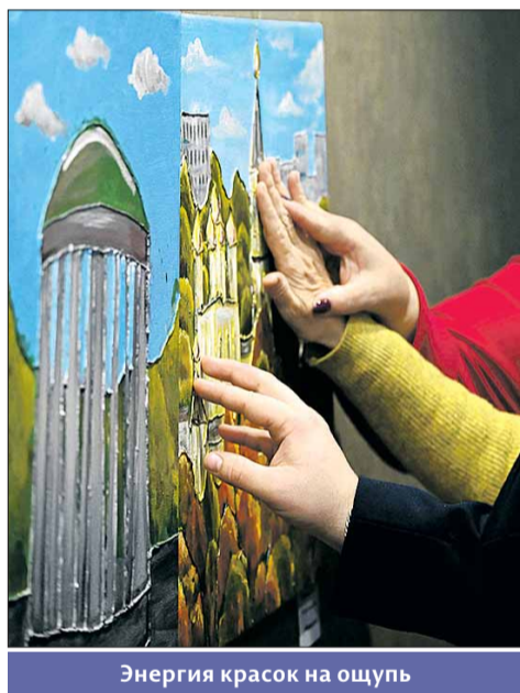
Энергия красок на ощупь

Он рассказал о работе над выставкой «Незримое искусство. Расширяя границы возможного». Идея выставки возникла случайно. Однажды идя на работу, он увидел двух незрячих девушек, которые стояли у входа в Эрмитаж. Он подумал, ну что же они увидят, ведь трогать руками ничего нельзя, будут просто ходить по залам? Так и родилась идея доступной выставки для всех, тема выставки: «Знакомство посетителей с настенной живописью города Пен-