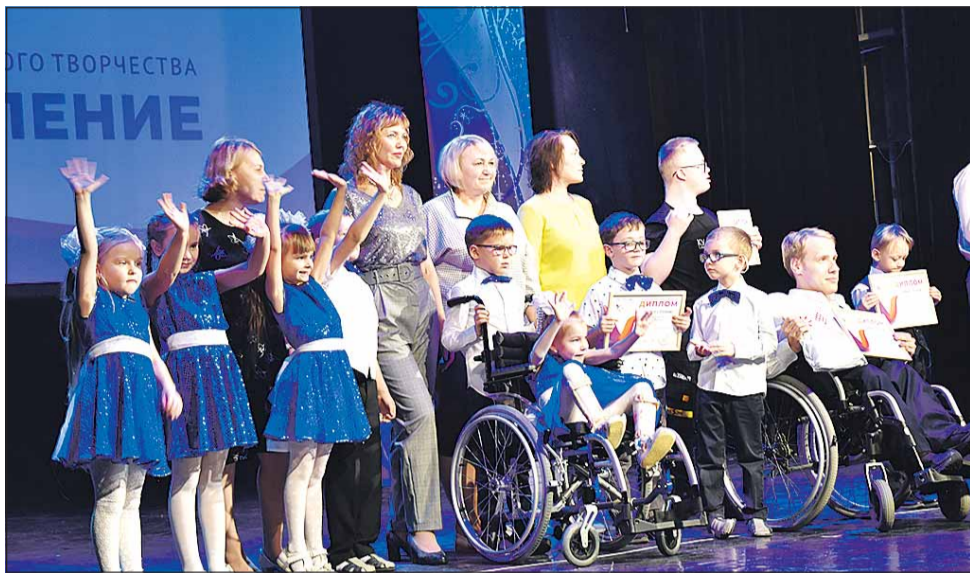
На сцене победители в номинации «Театральное и художественное слово»

В конце минувшего года традиционно в Пермском доме народного творчества «Губерния» прошёл краевой фестиваль инклюзивного творчества «Преодоление». Отличительной особенностью этого мероприятия стало участие в деловой программе топовых учреждений культуры России – Эрмитажа и Русского музея