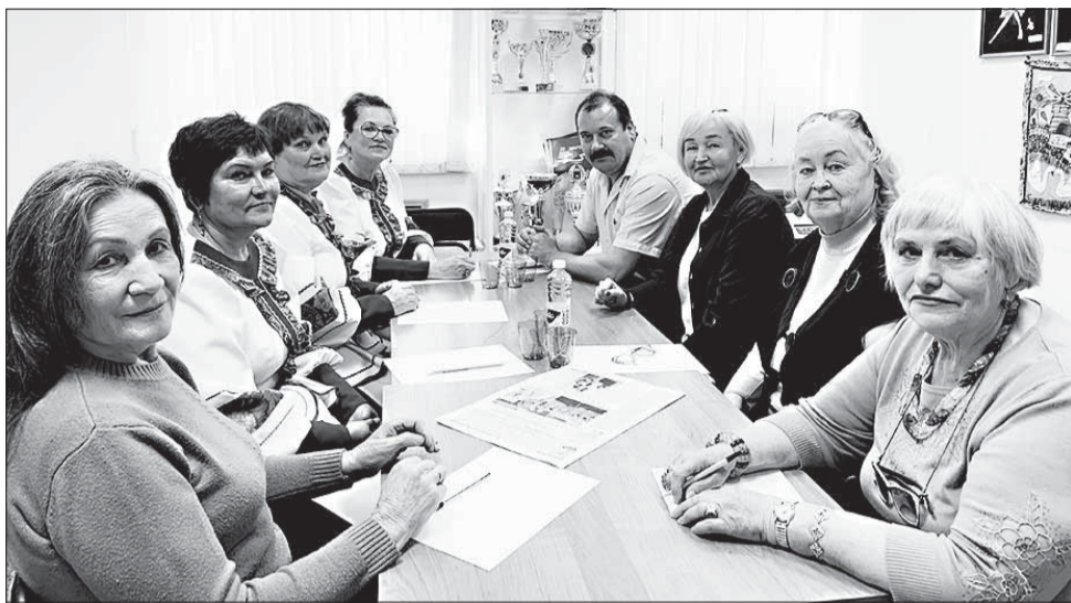
Встреча активов организаций