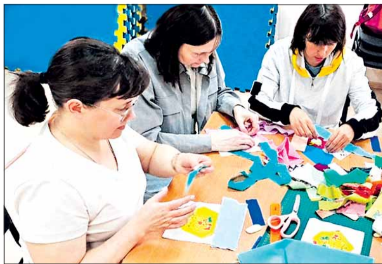
Участницы проекта осваивают технику пэчворк для создания большой коллективной картины «Наша Пермь»

Презентация проекта была проведена в Индустриальной и Свердловской районных организациях ПК ОВОИ.