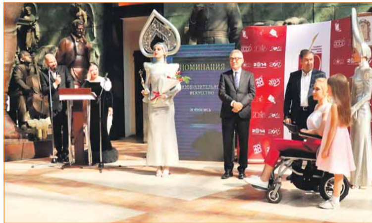
Церемония награждения победителей конкурса «Филантроп»