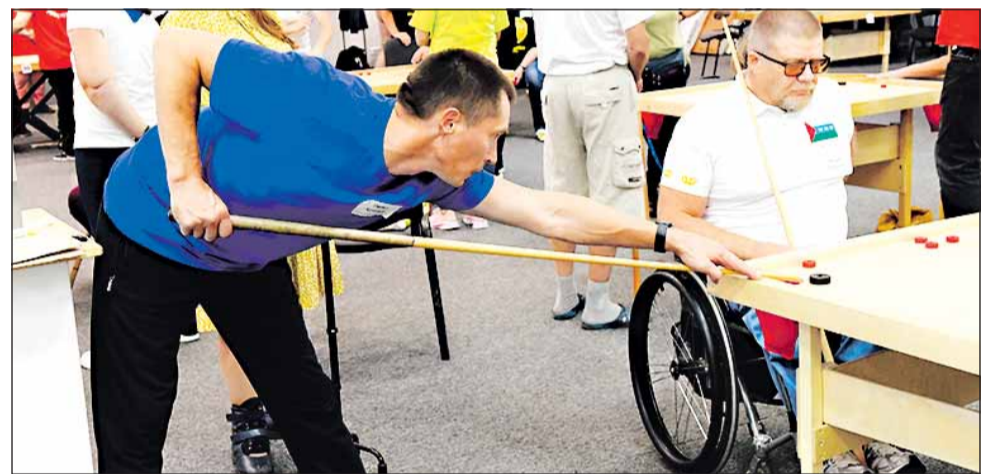
Один из моментов игры

Заглядывая в будущее и опираясь на успешный опыт проведенного фестиваля, можно уверенно отправлять заявку на организацию такого мероприятия в следующем году. Пусть приезжают и другие регионы. Санкт-Петербург, например, очень хорошо играет в новус. К сожалению, не было из Самары команды, там тоже любят эту игру. В Татарстане очень неплохо играют. Новусисты на уровне России все друг друга знают, кто чем живет и дышит. Поэтому, думаю, с удовольствием откликнутся на приглашение встретиться и посоревноваться. Так что будем ждать новых встреч. Чем больше будет проходить подобных турниров – тем лучше. Были бы средства и силы приехать, а играют все с удовольствием.