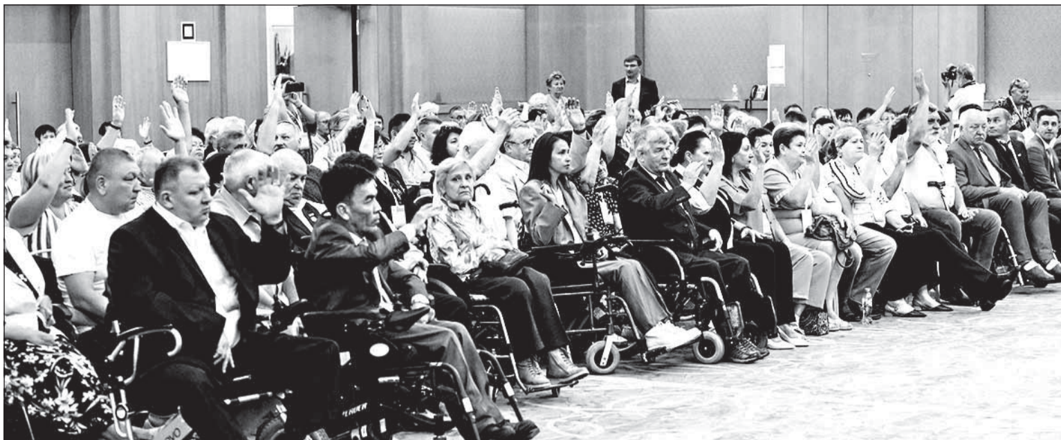
Заседание Центрального правления ВОИ