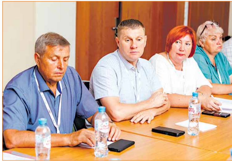
Заседание межрегионального совета «Приволжский»

● Заседание межрегиональных советов организаций ВОИ.