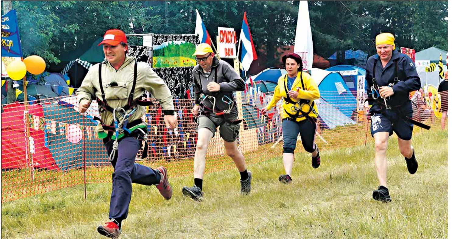
Впереди пешеходная полоса

Красиво, не спеша, стартует команда «Веселые татары» из Барды. Еще бы, ведь в команде три прекрасные дамы и один