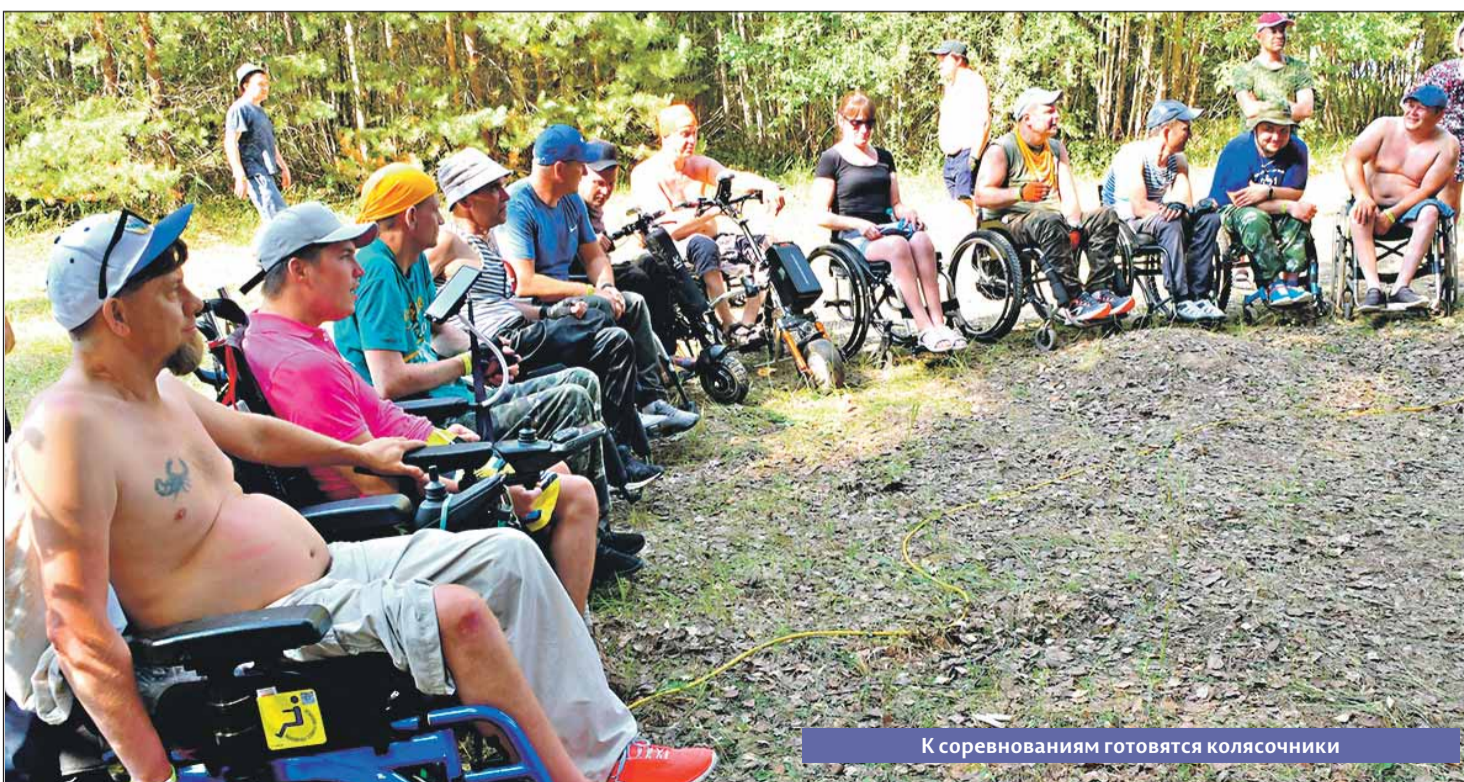
К соревнованиям готовятся колясочники