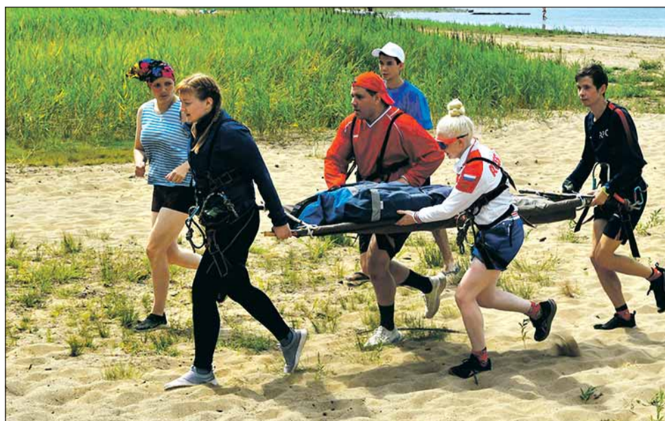
Самое сложное – бежать по песку