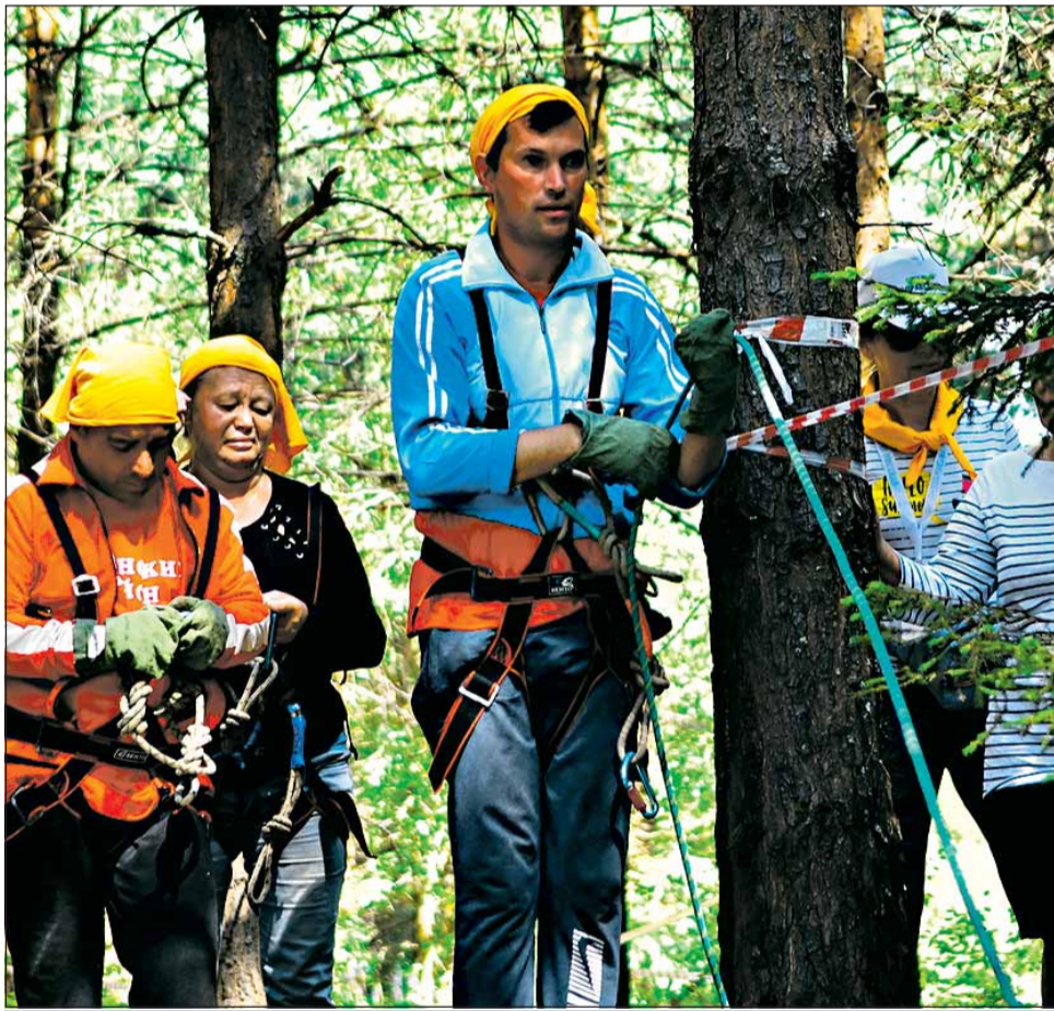
Переправа по бревну – дело серьезное