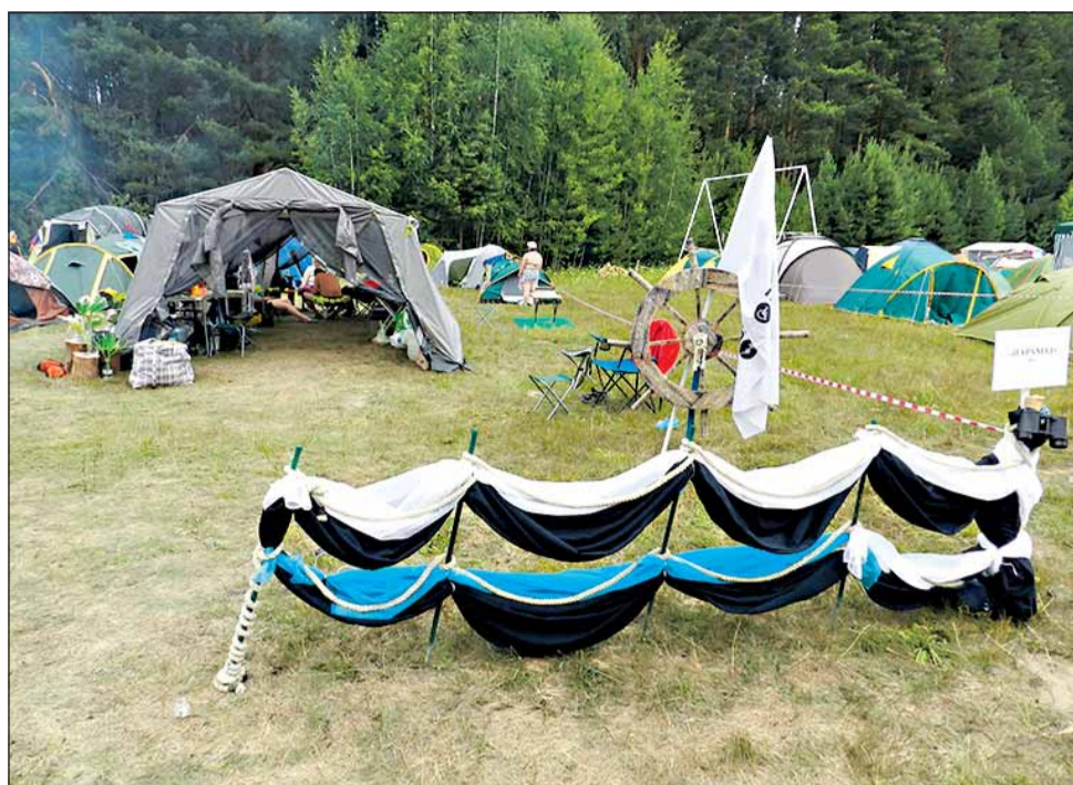
Бивуак команды ВОС «Параход»