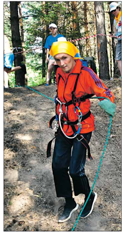
Спуск по склону на самостраховке

мужчина. Аккуратно собрали палатку, хорошо справились со спуском и подъемом, уверенно преодолели бревно. К сожалению, задержались на финише, бег по песку, да в горку – еще одно препятствие. Но общий результат хороший. Главное, сами довольны, что все преодолели, не сошли с дистанции.