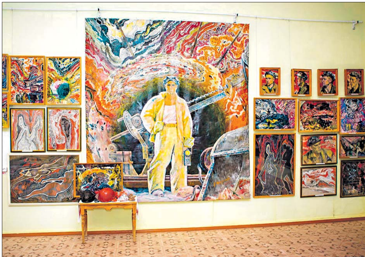
Картины Павла Шардакова

Последняя неделя марта выдалась насыщенной важными мероприятиями для членов Большесосновской районной организации ВОИ