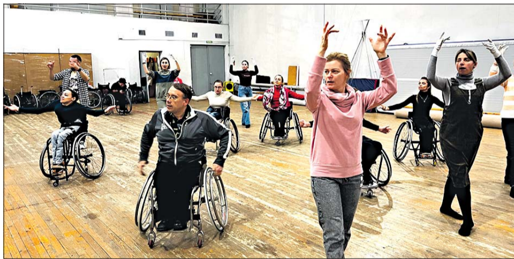
Участники проекта «Сила рук» на репетиции