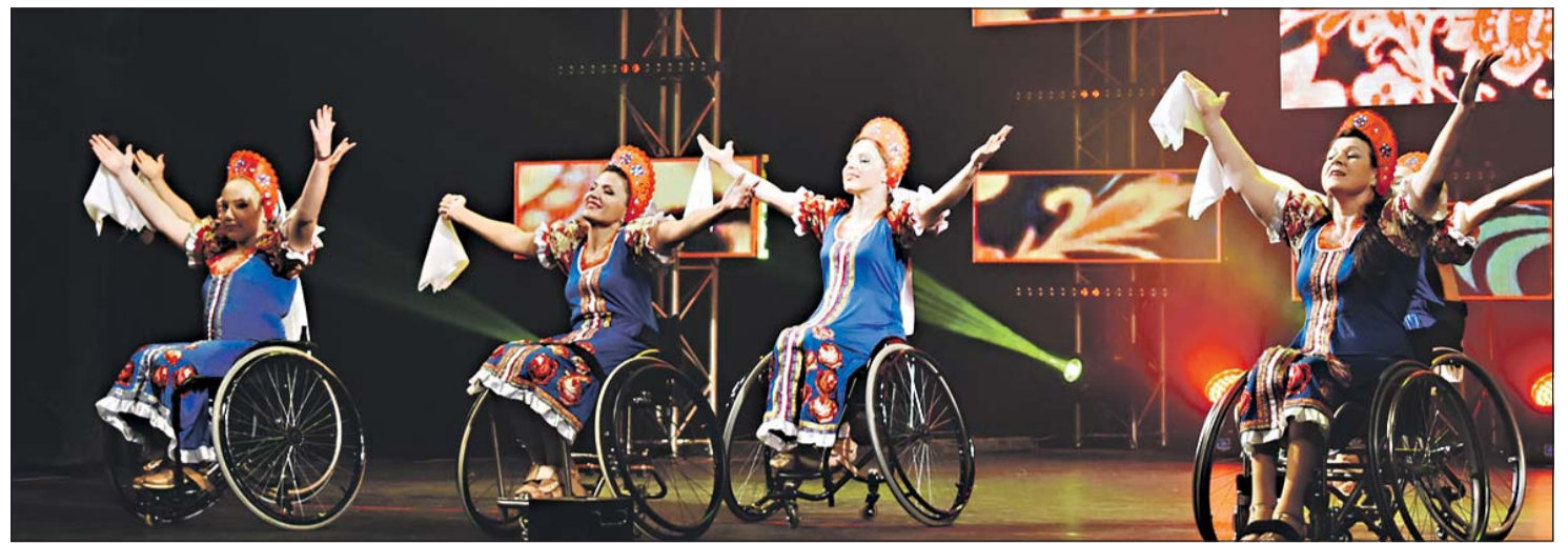
Выступает ансамбль танца на колясках «Гротеск»

Наш космический корабль пролетает над предприятиями Перми. Номинация «Техническое творчество, промышленность и предпринимательство» вручается за технические разработки и их социальную значимость, стремление к повышению профессионального уровня. В но-