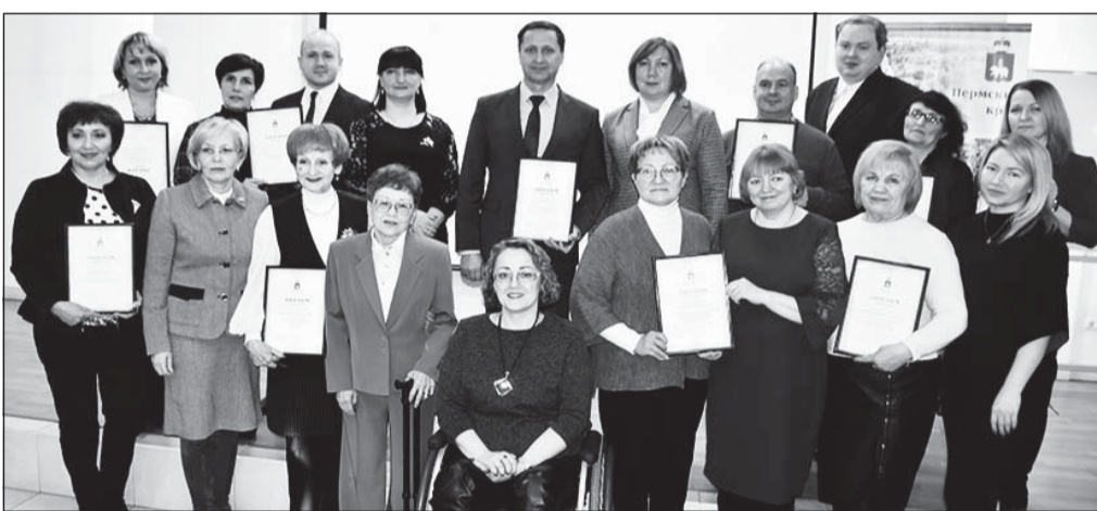
Победители конкурса «Доступная среда»