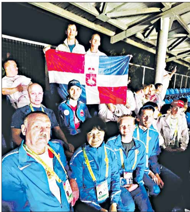
Команда Пермского края

В городе Сочи с 3 по 8 октября состоялось большое событие – международные комплексные спортивные соревнования «Летние игры паралимпийцев «Мы вместе. Спорт»