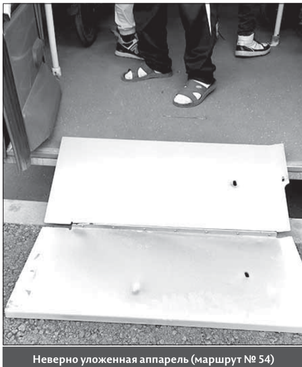
Неверно уложенная аппарель (маршрут № 54)