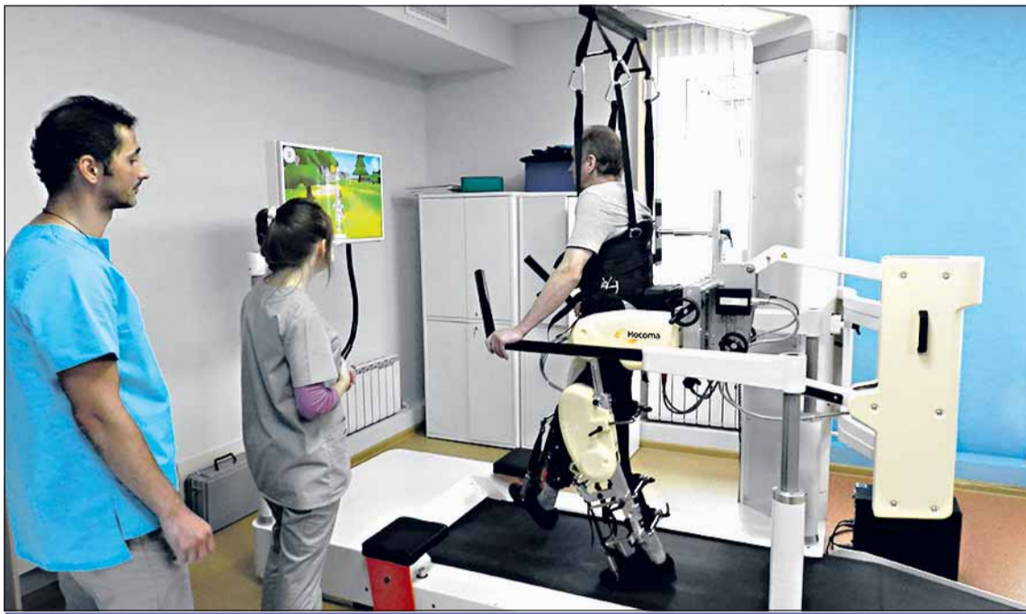
Занятие в зале ЛФК