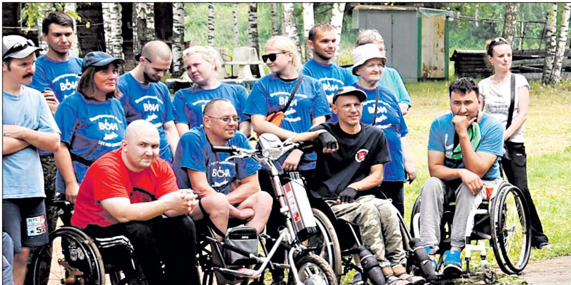
15-й юбилейный турслёт – одно из знаковых событий 2021 года

Пермская краевая организация ВОИ вновь выступила оператором конкурса Минсоцразвития Пермского края на лучший доступный объект социальной значимости «Доступная среда». АНО «Ресурсно-информационный центр «Доступная среда», учредителем которой является ПКО ВОИ, – исполнителем. Проводили обучающие семинары о нормативах доступности для муниципальных работников, предпринимателей, бюджетных организаций. На сегодня среди членов ВОИ 15 сертифицированных экспертов в сфере создания доступной среды.