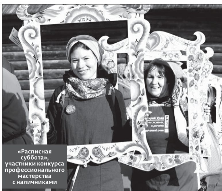
«Расписная суббота», участники конкурса профессионального мастерства с наличниками

– В Пермском доме народного творчества «Губерния» Год культурного наследия стартовал Всероссийским фестивалем зимнего фольклора «Сочельник». Фестиваль прошел с большим успехом, его гостями стали коллективы страны из Челябинска, Екатеринбург, Новосибирска, Липецка, Ижевска, Москвы и других городов. Участники увезли с собой яркие впечатления и оставили теплые отзывы с надеждой на ближайшие встречи. А впер-