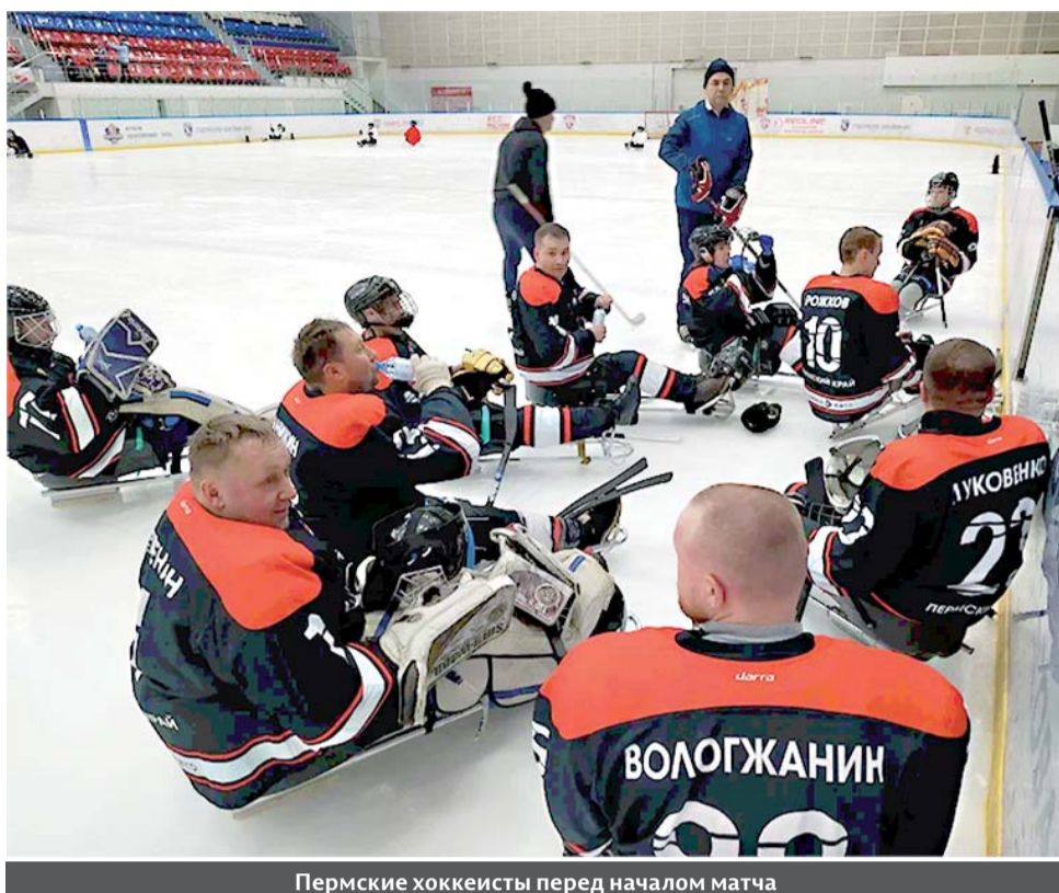
Пермские хоккеисты перед началом матча

Заключительным событием первого транша стал товарищеский матч: с одной из сильнейших на сегодняшний день команд «Удмуртия» мужественно сразилась команда Пермского края – «Урал». Соревнование состоялось в конце дека-