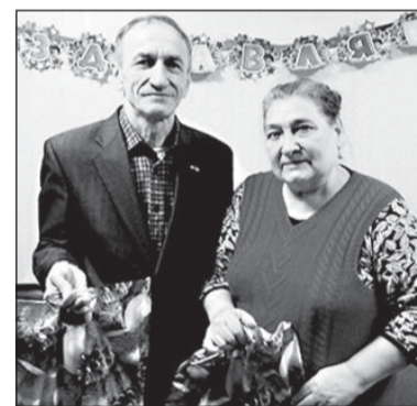
День здоровья в микрорайоне Уральский

В микрорайоне Портовый прошел День здоровья для инвалидов совместно с Центром здоровья г. Чайковского, посещение на дому, вручение подарочных наборов. То же самое — в микрорайонах Сайгатский и Уральский.