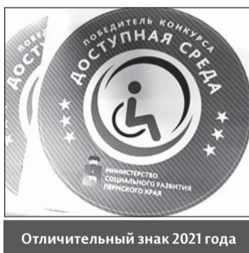
Отличительный знак 2021 года

✓ Торгово-развлекательный комплекс «Семья», г. Пермь (в номинации «Организации потребительского рынка и услуг»).