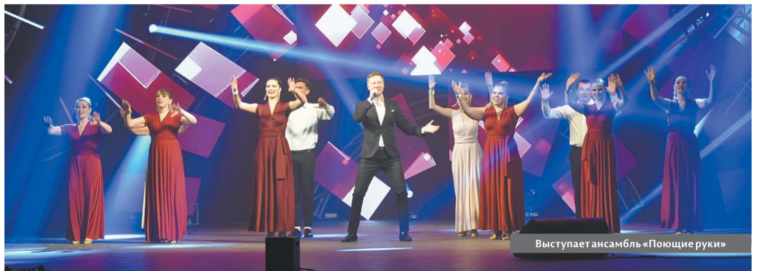
Выступает ансамбль «Поющие руки»

И вновь жители Перми рукоплескали лучшим из лучших, обладателям заветной премии «Преодоление», вручаемой в торжественной обстановке. Номинантами премии стали 17 человек