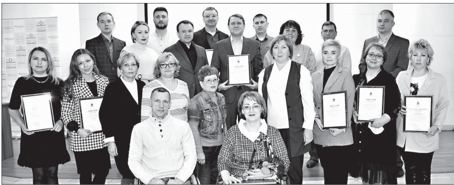
Победители конкурса на церемонии награждения в конференц-зале по адресу: г. Пермь, ул. Даншина, 7д