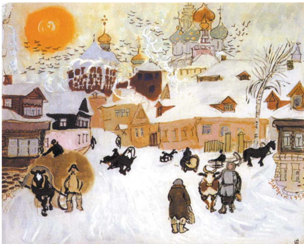
Татьянин день ассоциируется и с нашей русской зимой, с белым снегом, морозом и бледным зимним солнышком. «Зима в Загорске». Автор – заслуженный художник России, известный иллюстратор детских книг Татьяна Маврина