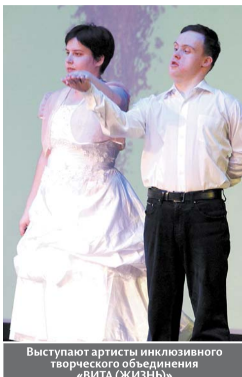
Выступают артисты инклюзивного творческого объединения «ВИТА (ЖИЗНЬ)»

– Это очень правильное название: концерт-благодарность. Потому что это не просто выступление на сцене одних лишь людей с инвалидностью, а именно инклюзивный концерт – в том числе с участием разных коллективов из Дома творчества «Губерния», в разных жанрах и стилях. Это