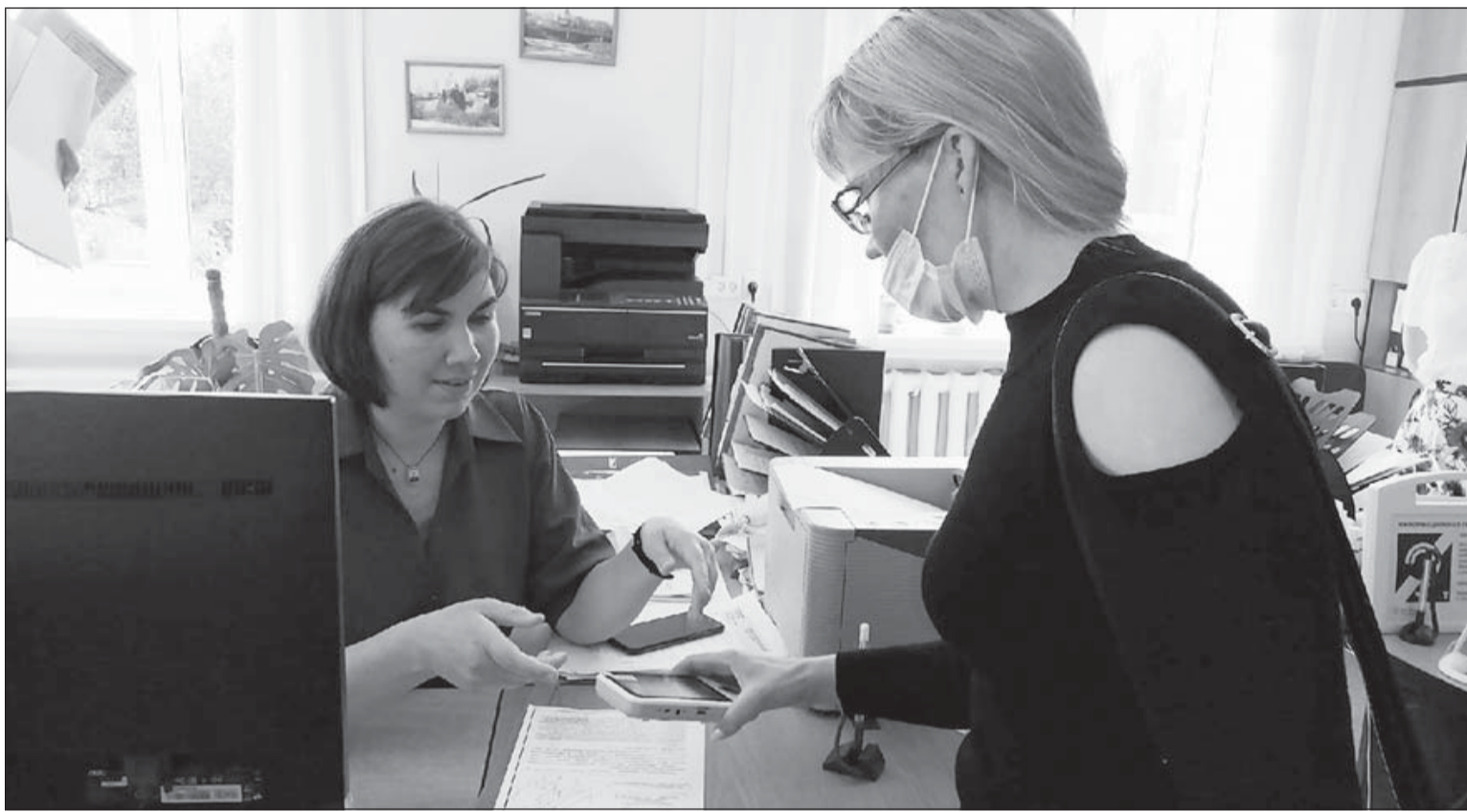
В управлении Пенсионного фонда

В Карагайском округе прошла акция по доступной среде, приуроченная к Международному дню защиты прав инвалидов. В ней участвовали пять человек. Прошли несколько социальных объектов